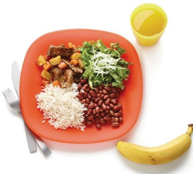
Figura 01: Alimentação escolar com arroz, feijão, carne com legumes e alface. Um copo de suco de laranja e uma banana de sobremesa.

Contribuir para o crescimento e o desenvolvimento biopsicossocial, a aprendizagem, o rendimento escolar e a formação de práticas alimentares saudáveis dos alunos, por meio de ações de educação alimentar e nutricional e da oferta de refeições que cubram as suas necessidades nutricionais durante o período letivo.